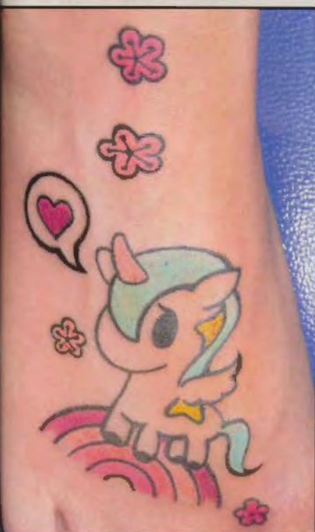
Naives Tattoo, das kein Wässerchen trüben kann.

Vor kurzem nistete sich ein Fernseh-Team in Monikas Studio ein um für die Doku-Soap »Schöne Schmerzen« ihren kitschigen Comic-Style zu Filmen.