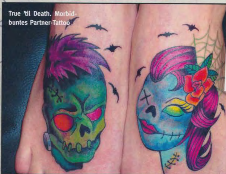
True 'til Death. Morbid-buntes Partner-Tattoo

Plots bekannter amerikanischer Shows hatte sie aber keine Lust. Sie tätowierte während des Drehs lieber ihre Freunde, mit denen sie vor der Kamera viel zu lachen hatte.